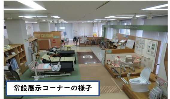
常設展示コーナーの様子